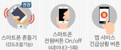
긴급상황 발생 시 비상호출 방법